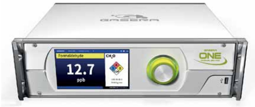
Рис. 3. Газоанализатор Gasera ONE Formaldehyde

загрязнения атмосферы для нужд Федеральной службы по гидрометеорологии и мониторингу окружающей среды (Росгидромет) и был рекомендован для использования в целях мониторинга загрязнения атмосферы на постах наблюдений и в передвижных лабораториях, оснащенных средствами регистрации данных.