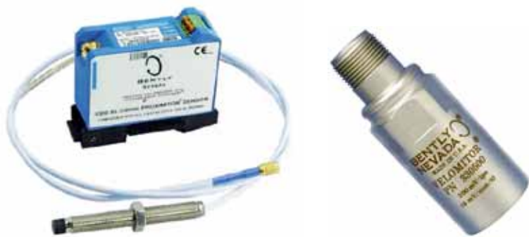
Рис. 2. Датчики системы вибрационного мониторинга компании Bently Nevada: токовихревой датчик серии 3300 XL (слева); пьезодатчик Velomitor® (справа)

ся одним из мировых лидеров в области контроля вибрации, в которой она работает более 60 лет. Линейка продукции Bently Nevada охватывает решения для измерения и контроля параметров вибрации, а также выполнения информационных и защитных функций любого динамического оборудования, что позволяет: