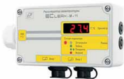
Рис. 4. EClerk-M-11-2Pt-HP для перевозки лекарственных препаратов

ках, морозильниках при температуре до -40^{\circ}\text{C} и т. д.