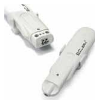
Рис. 5. Измерители-регистраторы EClerk-M-01-2Pt-C-G3 для сверхнизких температур

Применение: мониторинг температуры при грузоперевозках с возможностью контроля текущих значений на дисплее прибора, отправки отчета по электронной почте, распечатки отчета на термопринтере, удаленный