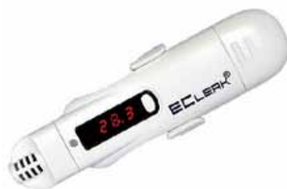
Рис. 1. Измеритель-регистратор EClerk-M: внесен в Госреестр средств измерений Российской Федерации, Казахстана, Республики Беларусь, Киргизии; межповерочный интервал – 2 года

Регистраторы изначально создавались как прецизионные приборы, предназначенные для применения в ситуациях, когда точность измерения имеет особое значение. С программным обеспечением разрешающая способность повышается и, на-