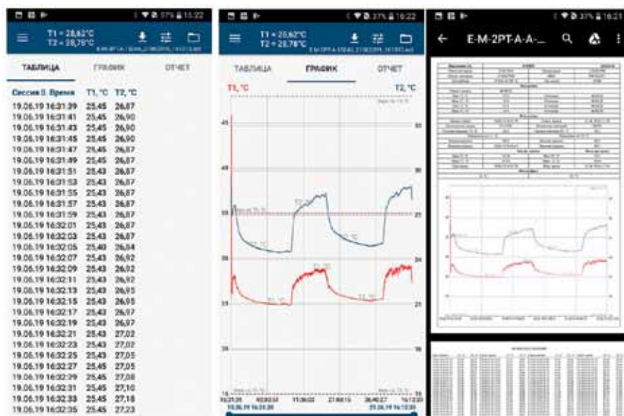
Рис. 3. Экраны мобильного приложения ECLerk-2.0 mobile: таблица, график, отчет

Применение: температурное картирование, мониторинг температуры в производственных помещениях, на оптовых складах, в аптеках, медицинских учреждениях, в холодильни-