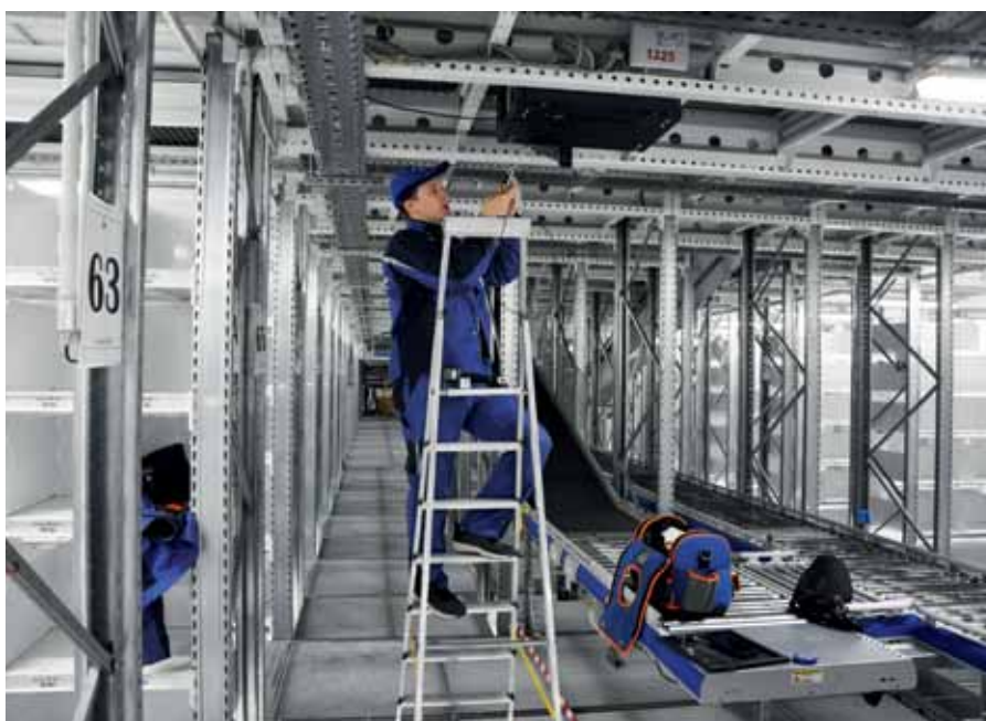
Рис. 3. Внедрение системы мониторинга «СканЭйр Темп ВП» на фармацевтическом складе: установка блока управления

Датчики мониторинга температуры ХК были размещены внутри камер для облегчения монтажа. Это обеспечивается за счет использования усиленной антенны с частотой 868 МГц, работающей по протоколу LoRaWan и позволяющей получать стабильный и качественный радиосигнал в условиях многоэтажности, большого количества перекрытий и стеллажей. С помощью специализированного ПО (рис. 2) клиент в любой момент,