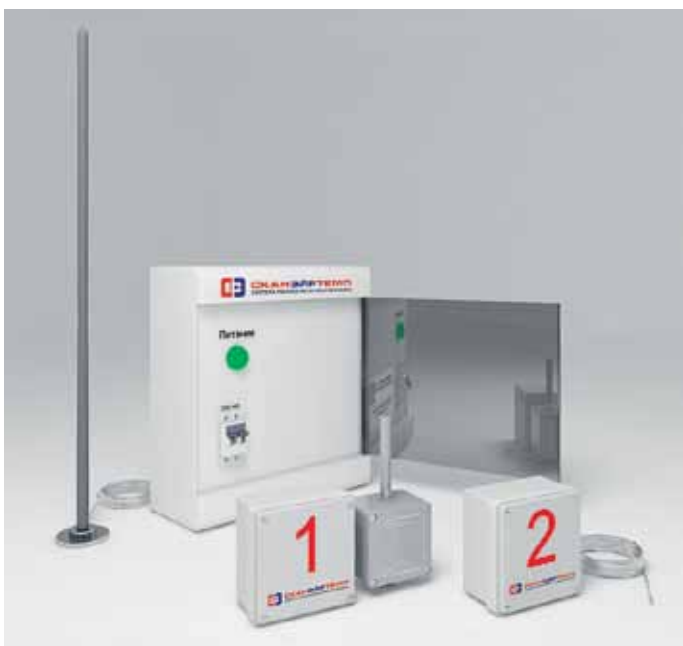
Рис. 1. Компоненты беспроводной системы мониторинга климатических параметров «СканЭйр Темп БП»: логгеры, базовая станция, антенна

ПО были получены аналитические данные. Информация с регистраторов сохранена в виде текстовых и зашифрованных файлов и занесена в протокол/отчет квалификационных испытаний в виде таблиц, графиков, 3D-моделирования данных мониторинга.