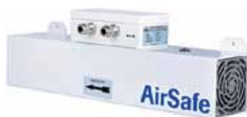
Рис. 5. Датчик пыли AirSafe

Промышленные пылемеры ProSens (рис. 4) компании ENVEA — это сочетание высокой точности, надежности и качества исполнения. Они построены на основе уже упомянутого трибоэлектрического метода, то есть фиксируют величину электрических зарядов, возникающих при трении разнородных материалов друг о друга. Приборы, использующие трибоэлектрический метод, не имеют подвижных частей, легко монтируются и эксплуатируются, а потому заслужили популярность и достаточно широко применяются.