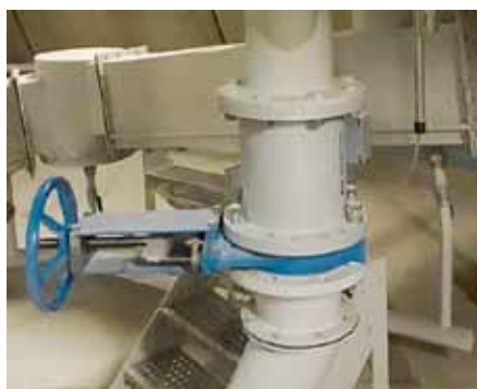
Рис. 2. Расходомер сыпучих материалов MaxxFlow