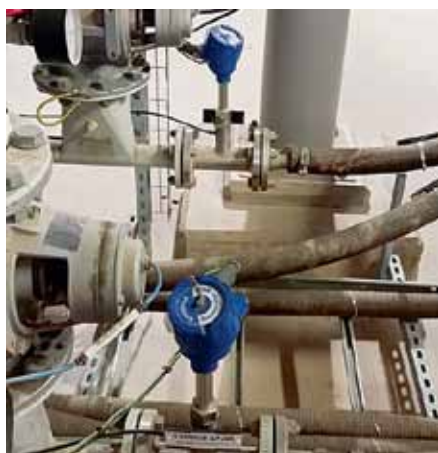
Рис. 3. Расходомер сыпучих материалов PicoFlow