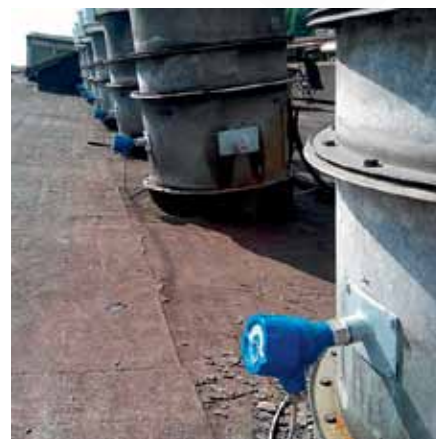
Рис. 4. Промышленный пылемер ProSens

по снижению выбросов загрязняющих веществ в атмосферный воздух в крупных промышленных центрах.