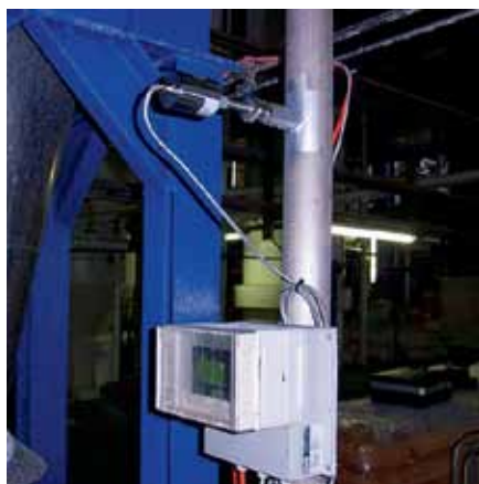
Рис. 1. Расходомер сыпучих материалов SolidFlow

Расходомеры SolidFlow установлены на заводах производства минеральных удобрений, где выполняют измерение расхода карбамида, на угольных электростанциях, где служат для измерения расхода угольной пыли, а также в пищевой промышленности (расход муки в системах бестарного хранения муки).