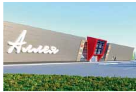
г. Южно-Сахалинск, ТРЦ «Аллея» АРМ «Ресурс» 210 ПУ; водосчетчики BOLID СВК-15-3-2-Б 100 шт.