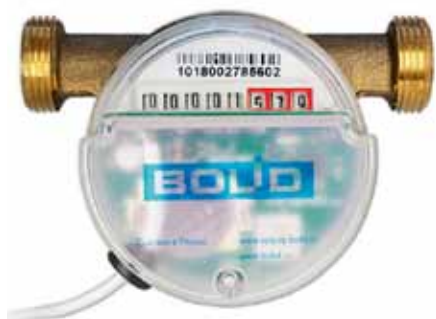
Рис. 2. Счетчик воды BOLID CBK-15-3-2-B

Минус данного решения — наличие батареи в регистраторе, срок службы которой в дежурном режиме составляет 6 лет. Но есть и плюс, как