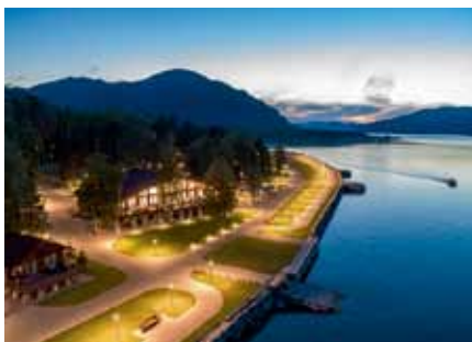
Алтайский край, СКК Altay Village АРМ «Ресурс» 110 ПУ