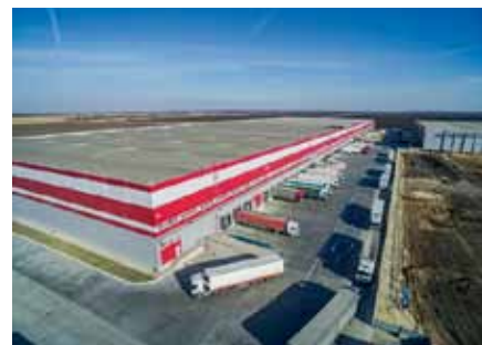
г. Ростов-на-Дону, СК Raven Russia, АРМ «Ресурс» 110 ПУ