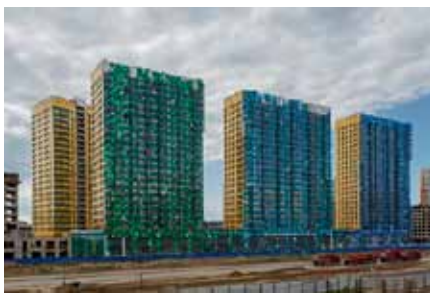
г. Санкт-Петербург, ЖК «Легенда Комендантского», АРМ «Ресурс» 6500 ПУ; водосчетчики BOLID СВК-15-3-2-Б 4449 шт.