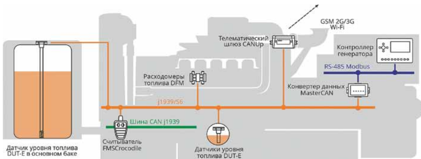
Рис. 2. Задачи, решаемые с помощью внедрения телематики ДГУ

При отсутствии цифрового контроллера и (или) при необходимости получения сигналов аналоговых устройств (датчиков, реле, ламп) используется цифроаналоговый преобразователь в CAN. Также MasterCAN DAC может управлять аналоговым оборудованием с помощью CAN-сообщений: например, переключить реле топливного насоса при достижении определенного уровня топлива