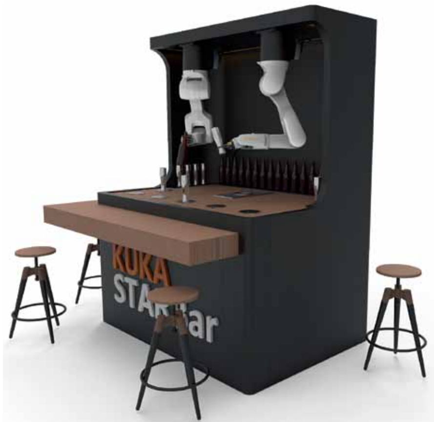
Рис. 5. Медиапроект: робобар

керамики на металл. Здесь можно обрабатывать сталь, алюминий и его сплавы, нержавеющую сталь, бронзу, латунь, различные сплавы черных и цветных металлов, синтетические материалы, то есть любое сырье, которое только может быть задействовано в производственном процессе;