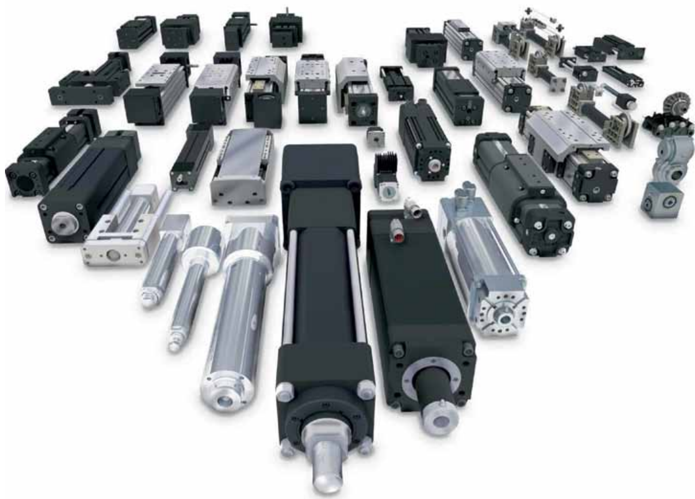
Рис. 2. Приводная техника компании Tolomatic

▶ производственными мощностями, оснащенными по последнему слову техники: высокотехнологичными токарными и фрезерными станками; современным шлифовальным, сверлильным, гибочным и пробивным оборудованием; оборудованием для плазменной и лазерной резки; термопластавтоматами; сварочным и высокоточным метрологическим оборудованием, автоматом для напыления