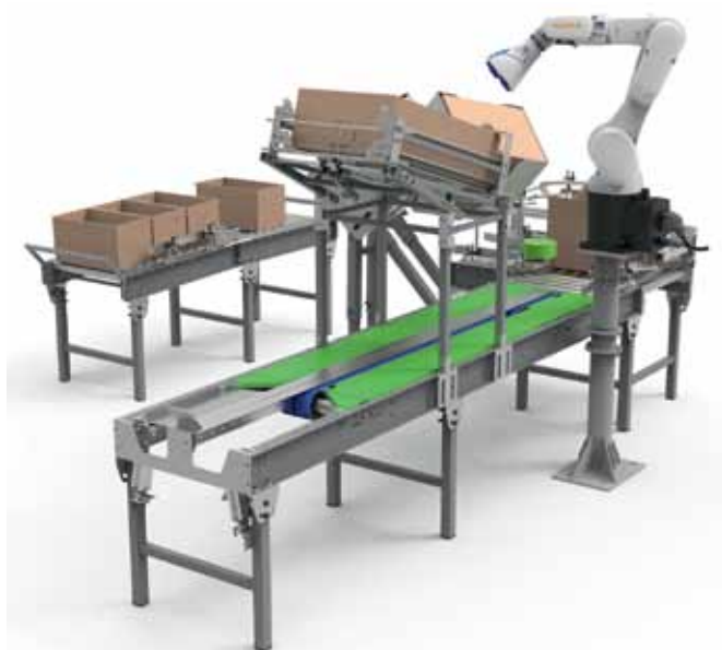
Рис. 3. Роботизированный комплекс паллетирования