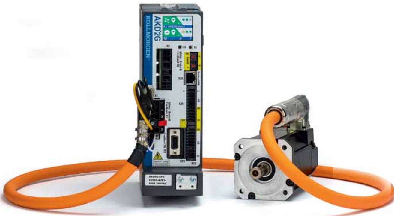
Рис. 1. Контроллер и сервомотор Kollmorgen

кой производительностью, простотой эксплуатации, надежностью и возможностью использования во многих сферах. ООО «Сервостар» обеспечивает поставку оборудования и комплектующих Kollmorgen в сжатые сроки на самых выгодных условиях, а также осуществляет комплексную поддержку клиентов.