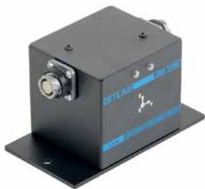
Рис. 1. Цифровой сейсмометр ZET 7156

► особо опасные и технически сложные объекты;