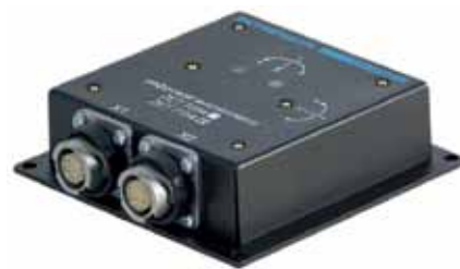
Рис. 4. Инклинометр ZET 7154