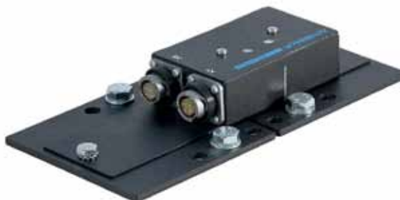
Рис. 2. Тензодатчик ZET 7110 DS