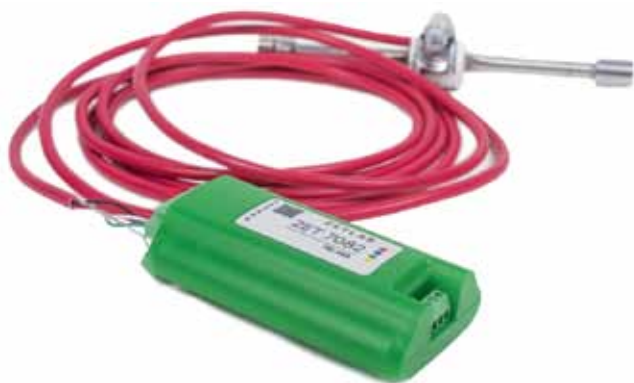
Рис. 3. Струнный тензометр ZET 7082