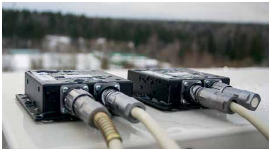
Рис. 5. Мониторинг крена с помощью инклинометров ZETLAB

Для решения специфических задач компания ZETLAB поставляет специализированные комплекты СМИК. К специфическим задачам относится, например, обнаружение сейсмической активности для лифтов в сейсмоопас-