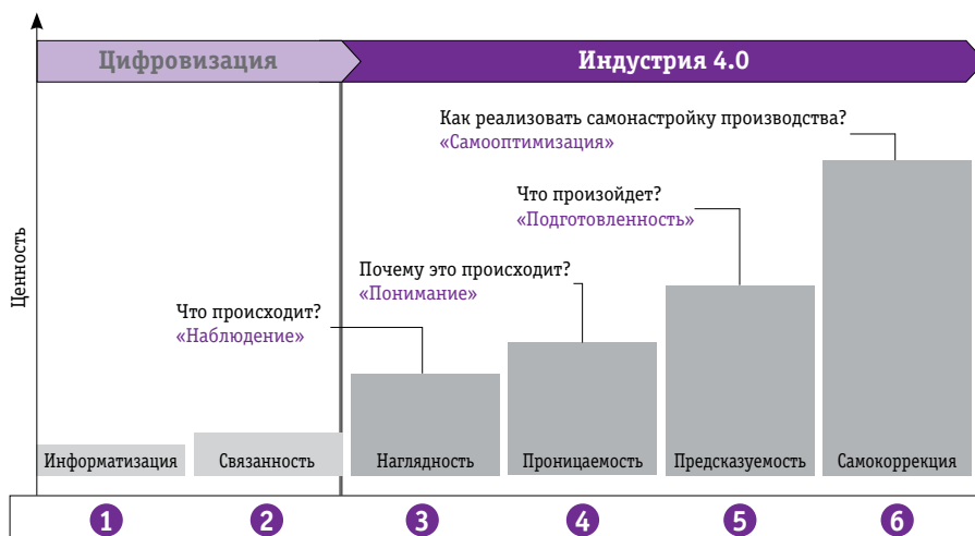
Рис. 1. Этапы цифровизации

На первом уровне необходимо внедрить систему сбора данных с существующих источников как на самом станке, так и в его окружении (ведь на состояние оборудования влияют не только, к примеру, внешние температура и влажность, но и состояние соседних станков). Для этого можно использовать штатные источники данных, а также дооснастить станки «умными» датчиками, которые имеют все необходимые интерфейсы и аппаратную часть для генерации и передачи большого объема данных. Следующим этапом является агрегация разнородных данных, их предобработка и орга-