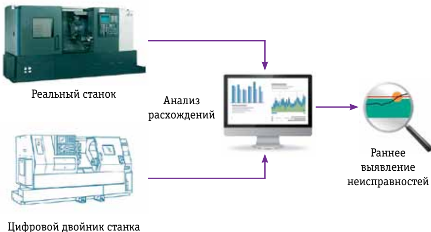
Рис. 5. Как работает предиктивная аналитика