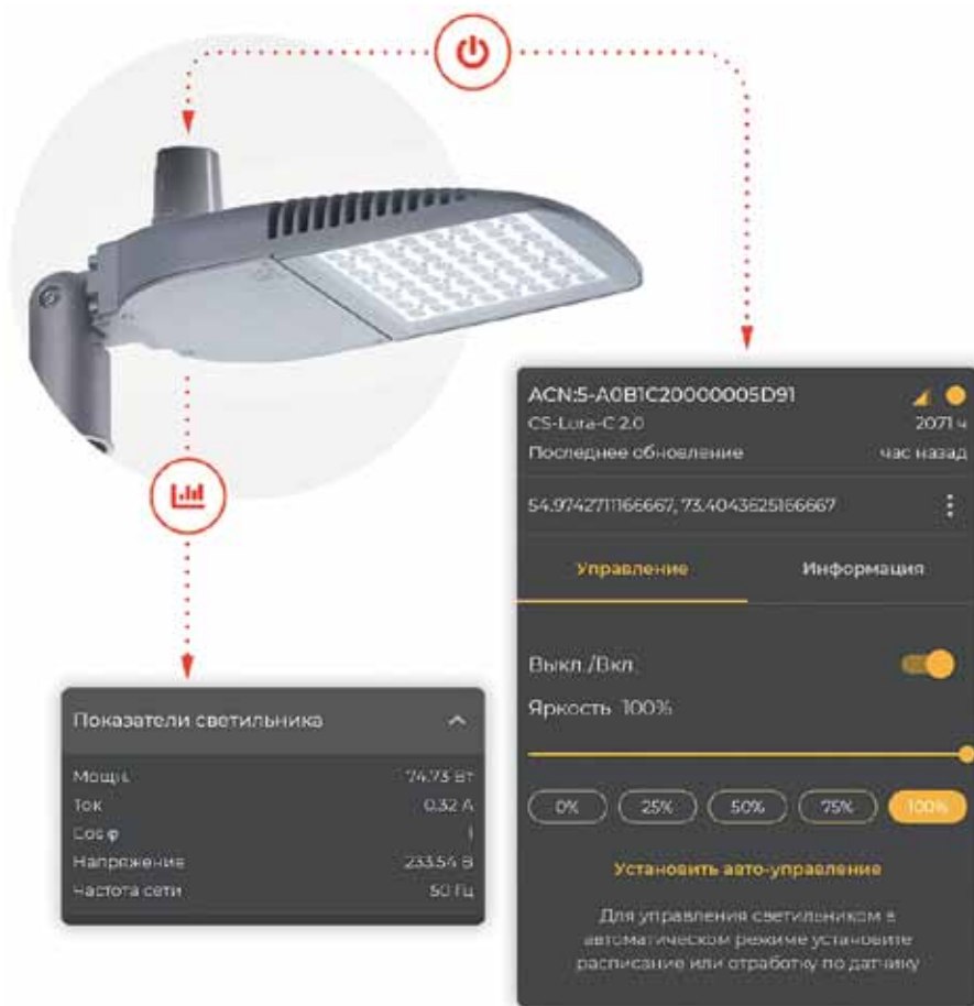
▲ Оцифрованный светодиодный светильник

А прямо сейчас работаем над очень интересным пилотным проектом, в рамках которого мы объединили в нашей платформе пять различных технологий связи одновременно: LoRaWAN, NB-IoT, G3 PLC, GSM и GPS. Идея этого пилота заключается в том, чтобы дать возможность заказчику самому оценить каждую из них и выбрать ту или те, которые наиболее эффективны