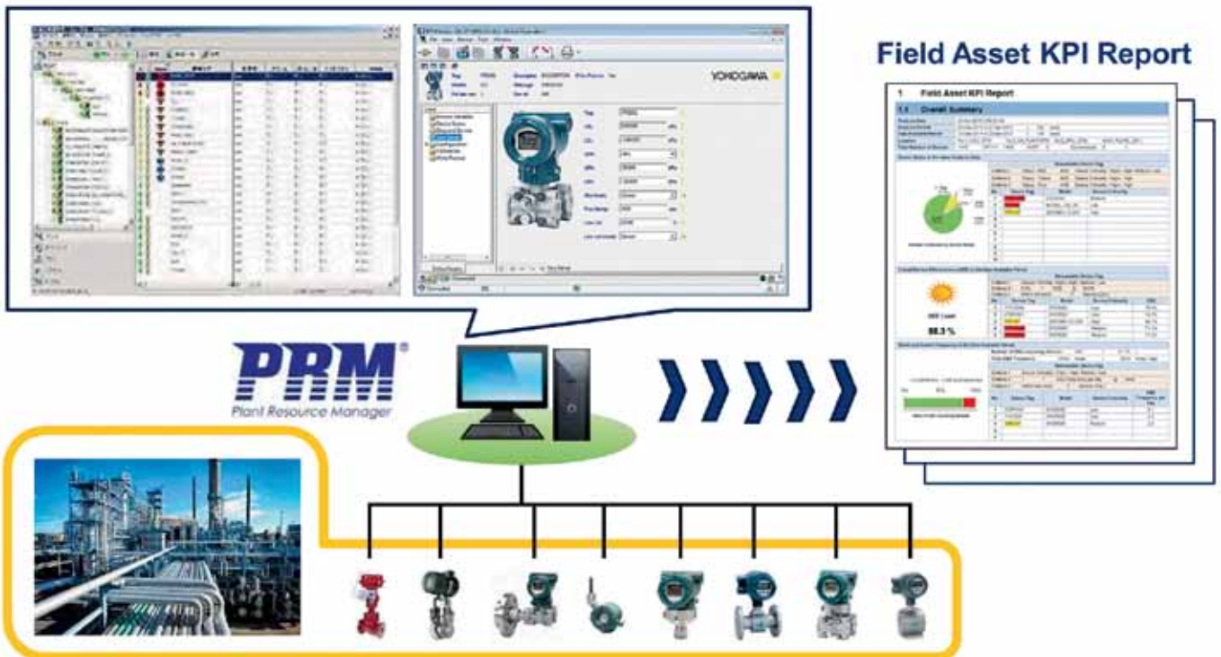
Рис. 1. Производственная система управления ресурсами PRM позволяет не только своевременно выявлять неисправные устройства, но и спрогнозировать их выход из строя (тренды)

жет существенно повлиять на четыре из них: неисправное оборудование, неисправности технологического процесса, начальные условия и незначительные прерывания техпроцесса. Поэтому планировать диагностику оборудования следует, поставив перед собой именно такие цели. Для собственной (внутренней) оценки производительности или для формирования задач по ее улучшению компании могут использовать показатель общей эффективности оборудования (англ. Overall Equipment Effectiveness – OEE), который обычно рассчитывается как произведение трех величин: доступности (реальной работоспособности), производительности и качества продукции. Причем снижение OEE однозначно указывает на уменьшение доходности предприятия. Для количественной оценки OEE требуется большой объем первичных данных, собрать и проанализировать которые можно только в производственных автоматизированных системах. Более того, в реальных условиях конкретного предприятия следует воспользоваться сравнением «до и после», то есть вычислить OEE до и после внедрения системы повышения эффективности технического обслуживания. Сделать это можно на основе имеющейся или планируемой производ-