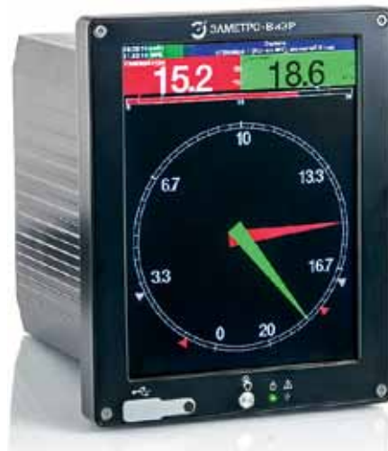
Рис. 3. ЭЛМЕТРО-ВиЭР-М7 – видеографический регистратор с 8-дюймовым экраном

Раз уж затронута тема расходомерии, то нельзя не упомянуть, что регистраторы ЭЛМЕТРО-ВиЭР могут использоваться в качестве вычислителей расхода сред по перепаду давления в соответствии с ГОСТ 8.586.(1-5)-2005. Также вычисление расхода по перепаду давления согласно упомянутому ГОСТу можно проводить и на модуле ввода/вывода ЭЛМЕТРО-МВВ.