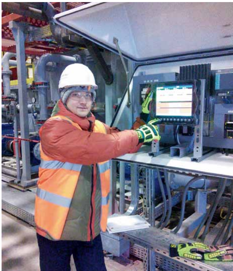
Рис. 2. Ввод в эксплуатацию ЭЛМЕТРО-ВиЭР-104 К в обогреваемом шкафу для условий Крайнего Севера

Управление печами для экономии топлива и поддержания стабильной температуры в большинстве случаев осуществляется путем включения/выключения ТЭНов по уставкам (для электрических печей) либо с помощью регулирования электродвигателей или хода плунжера насосов при обогреве жидким топливом по аналоговому выходному сигналу. При этом показания температуры поступают на контроллер от термосопротивления или термпары. Температурных контроллеров, позволяющих осуществить такой алгоритм, на рынке представлено великое множество, все они работают с использованием ПИД-регулирования, которое, естественно, присутствует и в регистра-