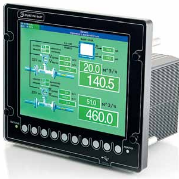
Рис. 1. Видеографический регистратор ЭЛМЕТРО-ВиЭР

падение метеорита он не сможет. Так почему же он видеографический ? По сути, все поддерживаемые регистратором режимы отображения (шкала, тренд, мнемосхема, циферблат и пр.) – это инфографика, то есть отображение статических данных за период времени. При этом отображение графика в видеографическом регистраторе не делает из графика видео. Ключевой особенностью отображения величин в виде чисел в регистраторах ЭЛМЕТРО является выделение цветом. А также представление цифровых значений в привычном и наглядном