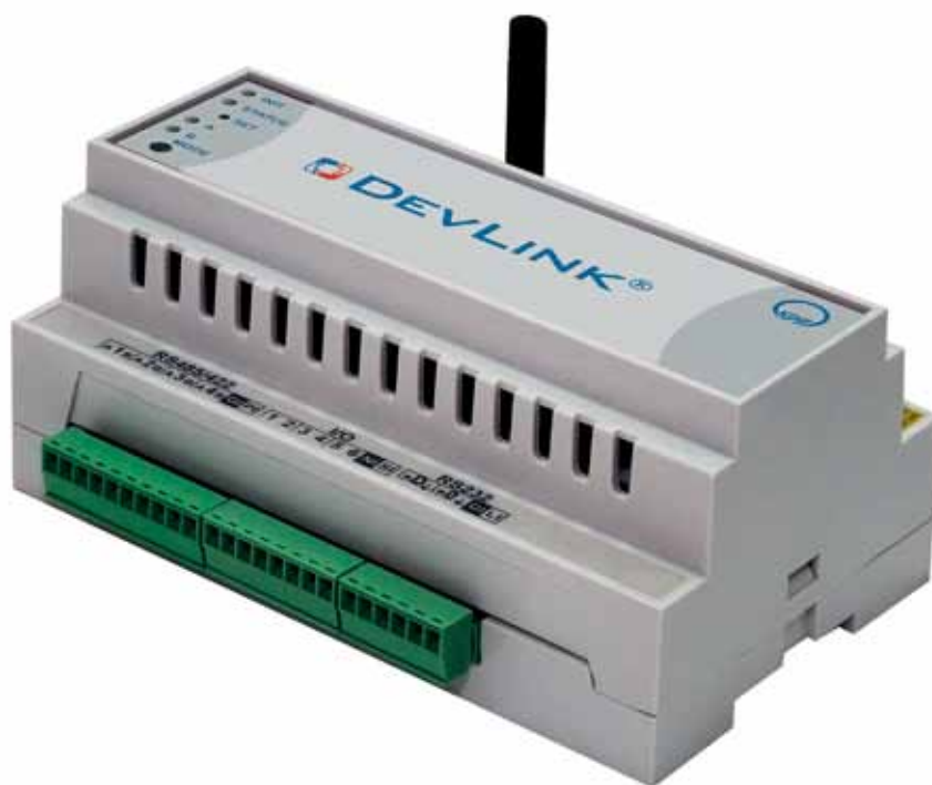
Рис. 1. Промышленный контроллер DevLink-C1000

Для их решения компанией «КРУГ» разработан программный модуль «Драйвер-шлюз», входящий в состав системы реального времени контроллера (СРВК) DevLink-C1000. Данная программа выполняет функцию арбитра и координирует информационные потоки от интеллектуальных устройств, подключенных к контроллеру.