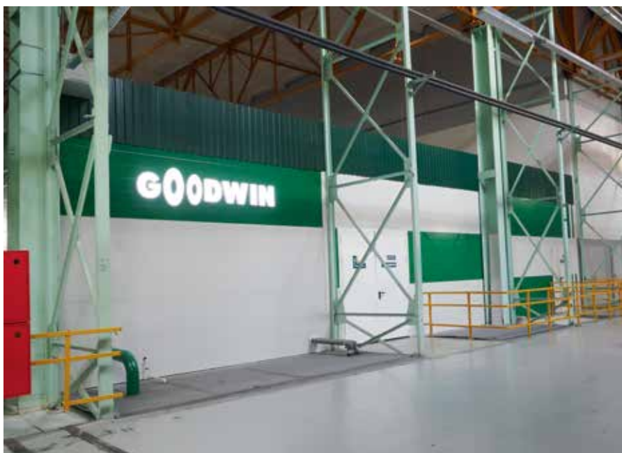
Рис. 4. Производственная площадка компании «Гудвин»

О. Саломахина: Серьезные испытания мы провели на стендах компании «ЭР-Телеком», владеющей большой сетью LoRaWAN национального масштаба; крупнейший из системных интеграторов, с кем мы работаем, – компания КРОК. В кооперации с ними мы провели успешные пилотные проекты для крупных промышленных компаний. В настоящее время мы заканчиваем разработку новой версии абонентских устройств, которые будут работать в сетях NB-IoT, ведем переговоры с операторами сотовой связи о возможности тестирования наших решений в интересах их клиентов. Самый большой плюс от работы в партнерских проектах – это поиск новых интересных решений для клиентов, обмен опытом, возможность создания большого комплексного продукта. Несмотря на то что «Гудвин» – компания небольшая, нам есть, чем обогатить решения наших партнеров. 23-летний опыт работы на постоянно меняющемся рынке научил нас быть гибкими, но стой-