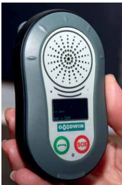
Рис. 2. Абонентское устройство системы

Мы попытались, и небезуспешно, сделать собственную станцию LoRaWAN, однако (в первую очередь по экономическим соображениям) пока не даем дальнейшего хода этой разработке. А вот маяки BLE мы сделали сразу в нескольких вариантах: для исполь-