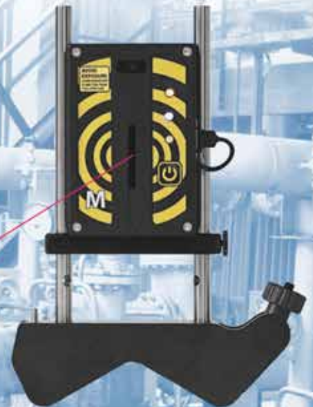
Измерительный блок М