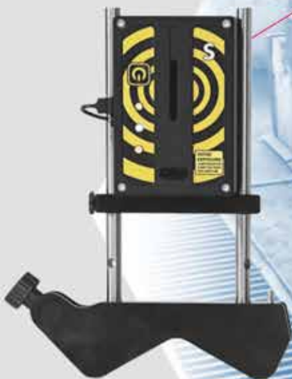
Измерительный блок S