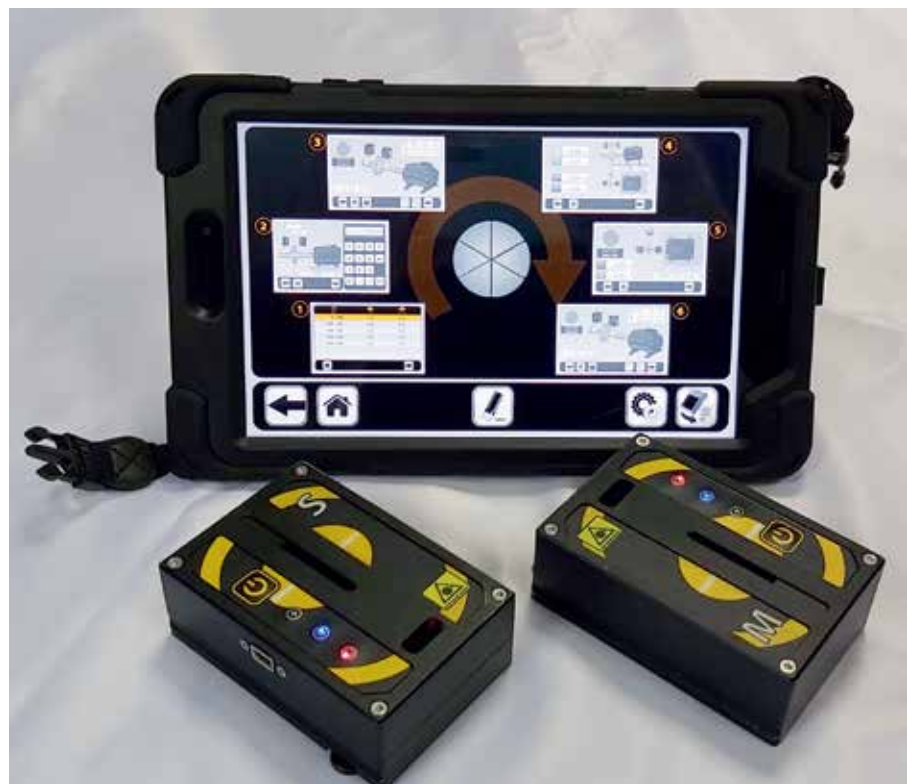
Рис. 1. Портативная система VIBRO-LASER

Сегодня системы для лазерной центровки валов получили достаточно большое распространение. Однако и здесь есть свои сложности. При выборе такой системы для центровки своего оборудования специали-