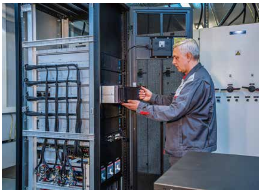
Рис. 3. Модульный ИБП серии MR33

ИСУП: Еще один ключевой параметр для промышленных ИБП – ко-