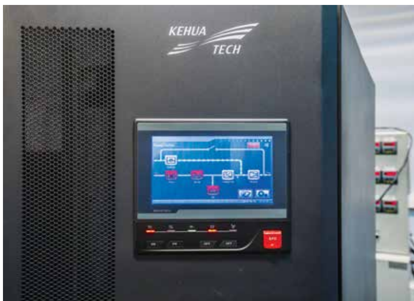
Рис. 4. ИБП KeHua оснащены сенсорными цветными дисплеями

того, KeHua – единственный из китайских производителей ИБП, имеющий сертификат качества, выданный Министерством энергетики Китая, и поставляющий свою продукцию для атомных электростанций.