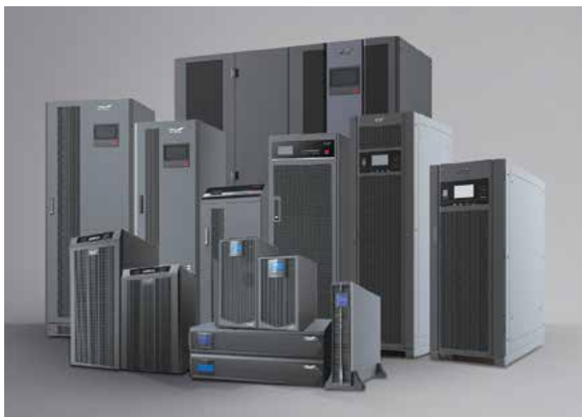
Рис. 1. Линейка ИБП компании Keuhua

О. Быкова: На рынке транспортной инфраструктуры компания Keuhua участвовала в реализации разнообразных проектов в 70 городах, 50 аэропортах и на 100 железнодорожных магистралях, среди которых можно упомянуть Панамский метрополитен, систему наземного метро в Малайзии, железнодорожные проекты в Эфиопии, проекты строительства автомобильных тоннелей в Швеции, а также проекты, связанные с реконструкцией пекинского международного аэропорта Шоуду и международного аэропорта Фалеоло на о. Самоа.